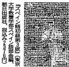
「スペイン語初級第3巻」(東京大学教養学部スペイン語部編、朝日出版社、税込み3,760円)

スペイン語は時々「学外」のが易しいと知られます。音節面では確かにそうで、母音は5つしかなく、綴りもアクセントも厳格な規則に従っています。英語との違いは明白です。一方で、動詞が主語に応じて活用したり、名詞に性があつたり、主観性を表す様々な表現がある点などに、響くは戸惑つたかもしれません。要は、きちんと学ばなくては、その言葉も難しく奥深いのです。