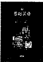
『現代中国語』(編著者：吉川雅之、監修者：白羽社、税込み800円)

Zhī zhī zhě, bùrú hào zhī zhě. 「之を知る者は、之を好む者に如かず。」 〔『論語』雍也篇〕